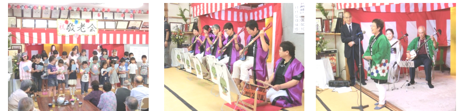
余興のトップは恒例の子ども会さんの歌のプレゼント。 皐月会さんのスコップ三味線。 西藤会さんの民謡。

＜＜自治会員の皆様ご協力をお願いします！＞＞ 史誌編纂にご関心のある方はお申し出いただきご協力をお願いします。ご家庭に残された江戸、明治、大正、昭和時代の資料や写真あるいは物品などがありましたら、記録に残し町民史に反映したいのでご協力をお願いします。