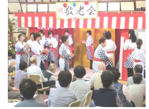
赤十字奉仕団・更生保護女性会さんのソーラン節。